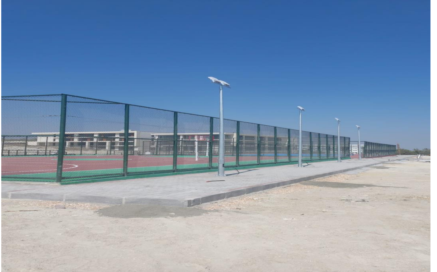
Tarsus Üniversitesi Spor Tesisleri Yapım İŖi