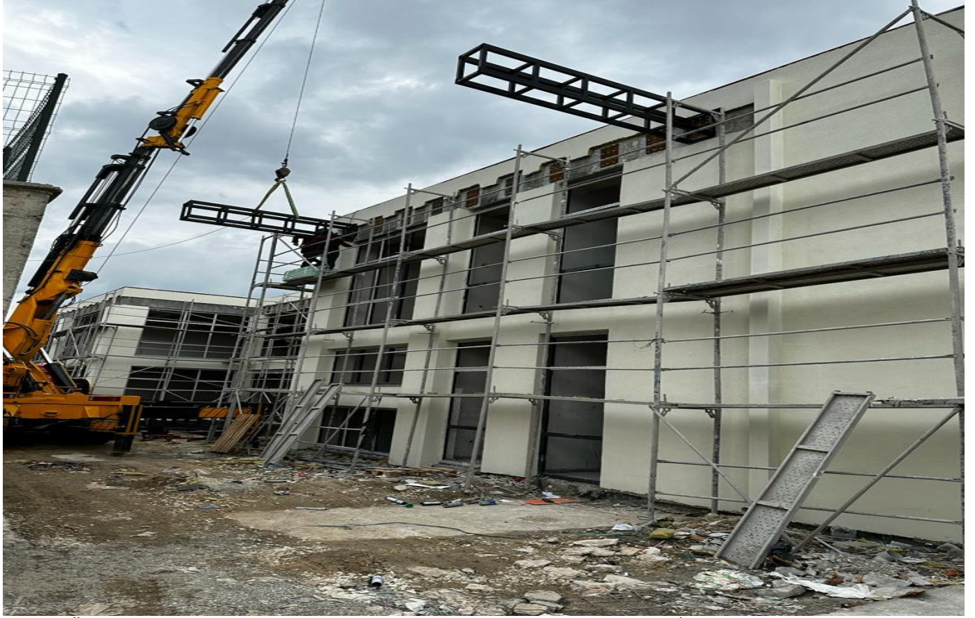
Tarsus Üniversitesi Yabancı Diller Hazırlık Sınıfları Derslik Binası Yapım İşi