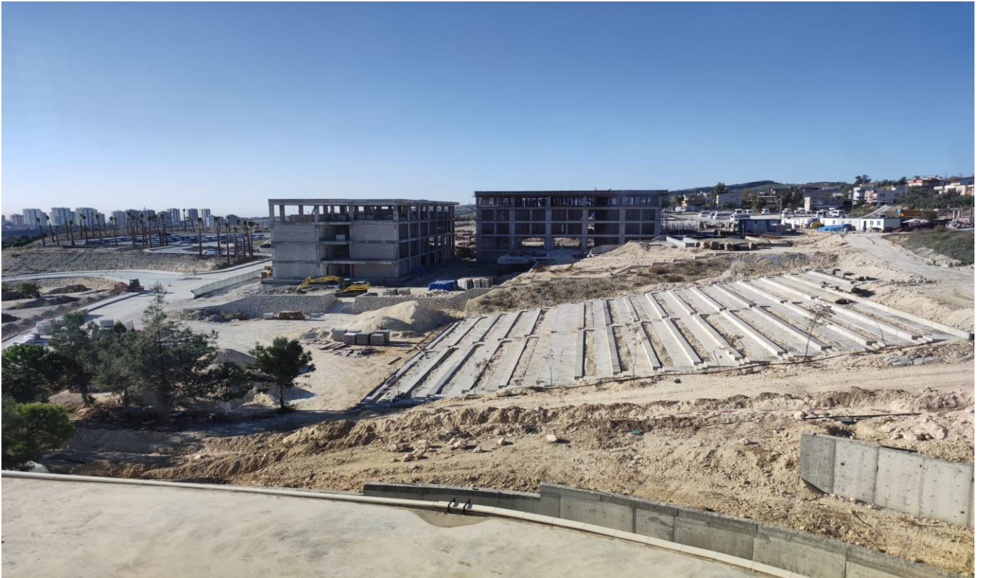
Tarsus Üniversitesi Mühendislik Fakültesi Yapım İşi