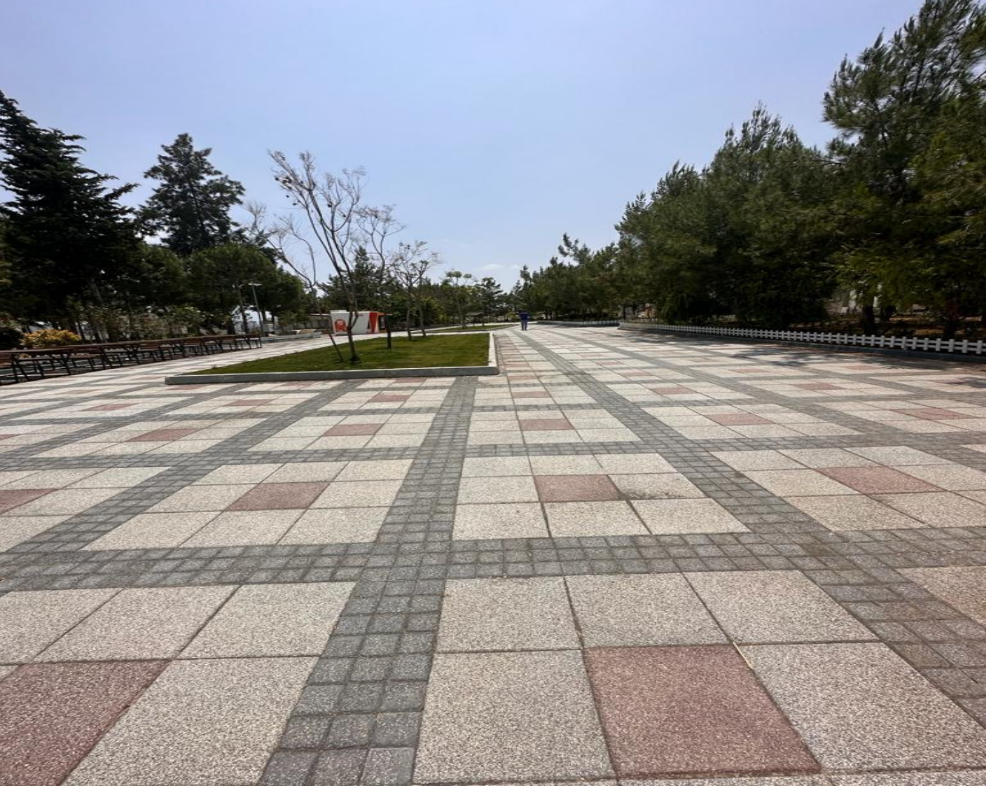
Tarsus Üniversitesi Çevre Düzenleme ve Yol Aydınlatma Yapılması İşİ

Üniversitemiz kuzey yerleşkesinde 14.11.2022 tarihinde yapımına başlanan Tarsus Üniversitesi Çevre Düzenleme ve Yol Aydınlatma Yapılması İşinin sözleşme bedeli 4.747.000,00 TL. Yapım işinin % 100'ü tamamlanmıştır.