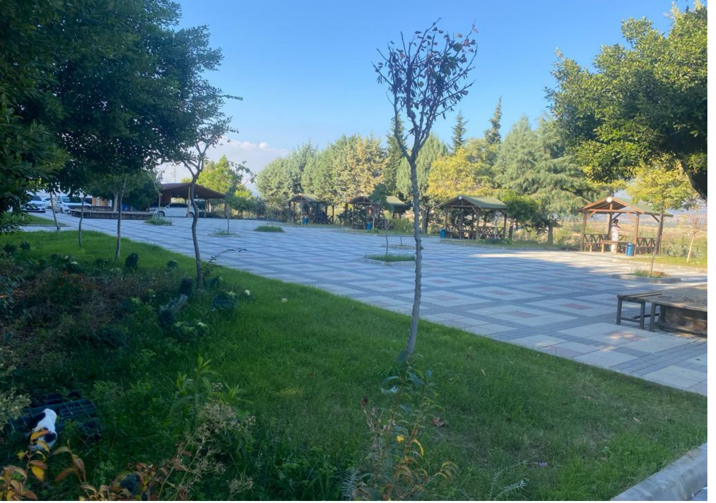
Tarsus Üniversitesi Çevre Düzenleme ve Yol Aydınlatma Yapılması İşi