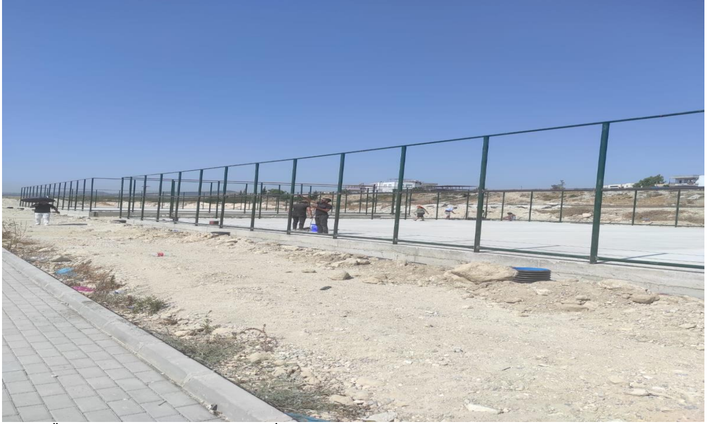
Tarsus Üniversitesi Spor Tesisleri Yapım İŖi