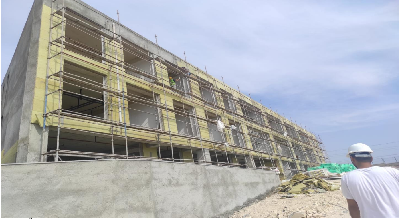
Tarsus Üniversitesi Yabancı Diller Hazırlık Sınıfları Derslik Binası Yapım İşİ

Üniversitemiz kuzey yerleşkesinde 18.11.2022 tarihinde yapımına başlanan Tarsus Üniversitesi Yabancı Diller Hazırlık Sınıfları Derslik Binası Yapım İşinin sözleşme bedeli 38.880,00 TL. Yapım işinin % 94'dü tamamlanmıştır.