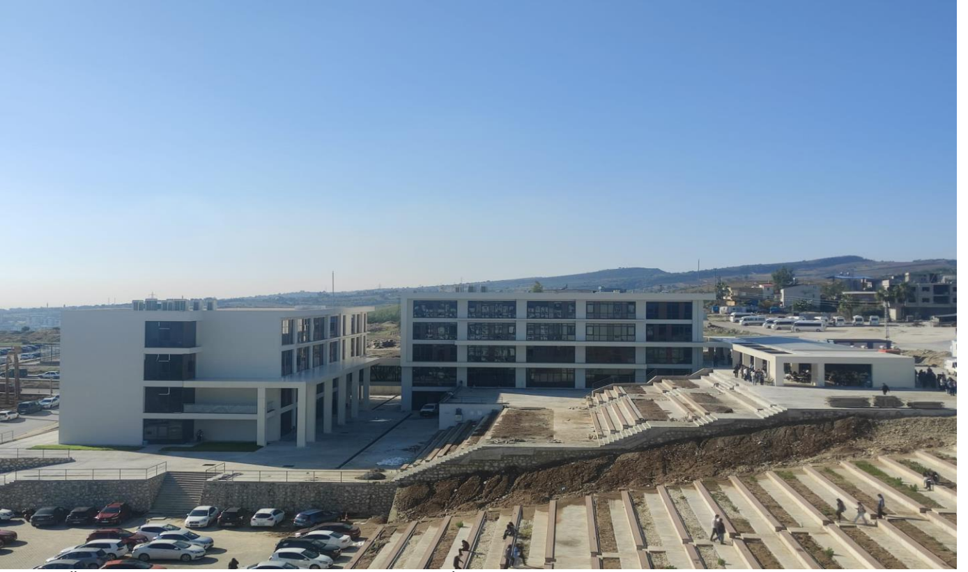
Tarsus Üniversitesi Mühendislik Fakültesi Yapım İşi