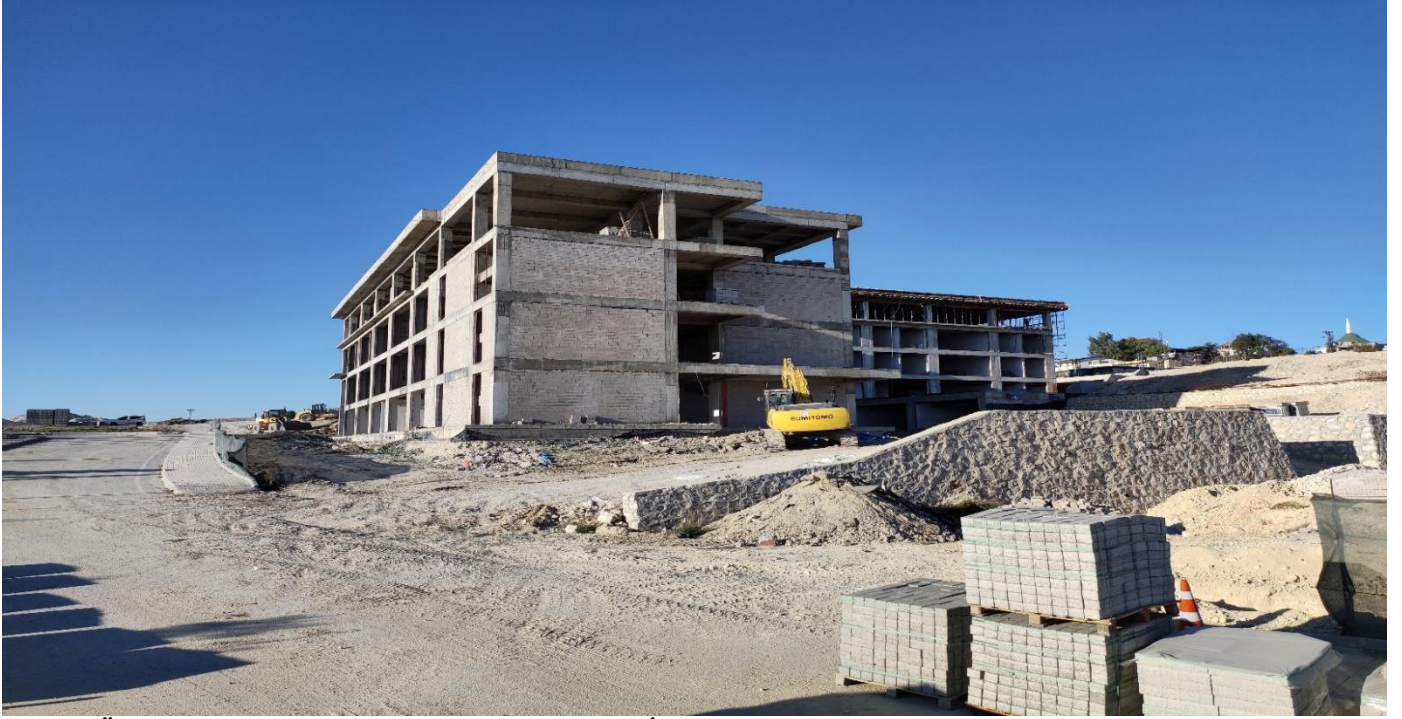
Tarsus Üniversitesi Mühendislik Fakültesi Yapım İşi

Üniversitemiz kuzey yerleşkesinde 11.08.2021 tarihinde yapımına başlanan Tarsus Üniversitesi Mühendislik Fakültesi Yapım İşinin sözleşme bedeli 23.391.500,00 TL. Yapım işinin % 100 'ü tamamlanmıştır.