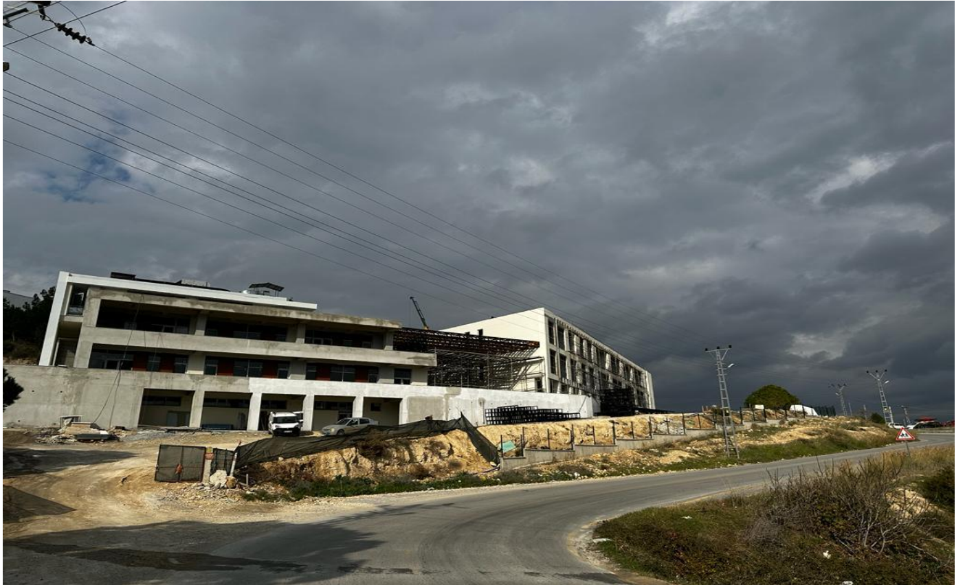
Tarsus Üniversitesi Yabancı Diller Hazırlık Sınıfları Derslik Binası Yapım İşi